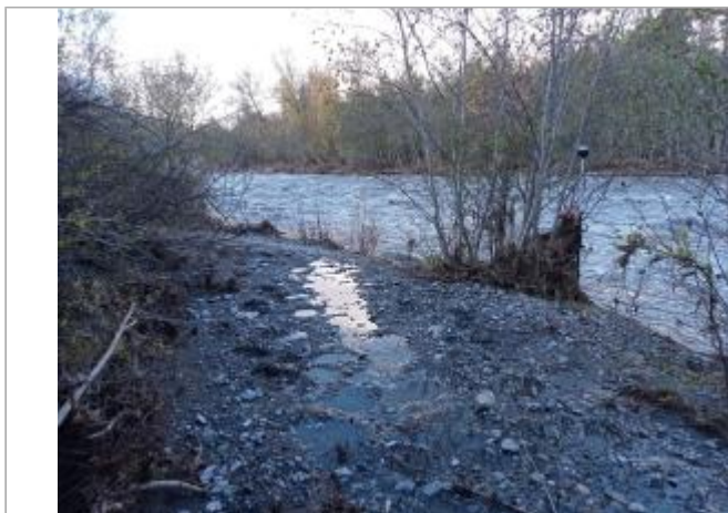
Vue générale du site.

Coordonnées WGS84 : X: 6.06797820 / Y: 44.68583230