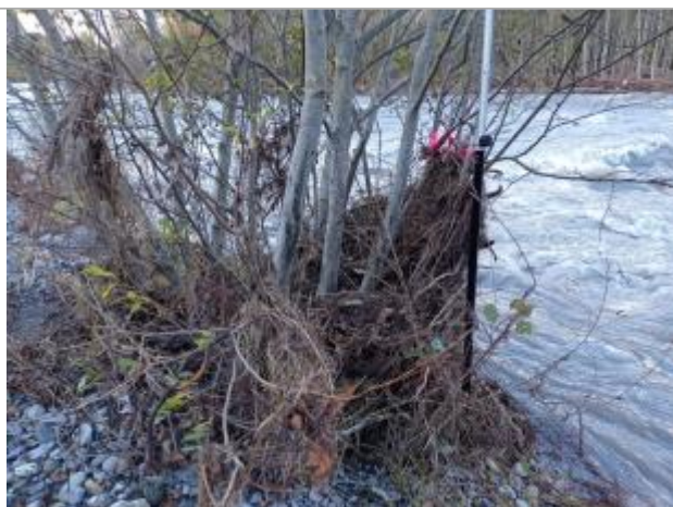
Vue rapprochée du repère.