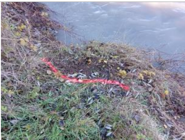
Vue rapprochée du repère.