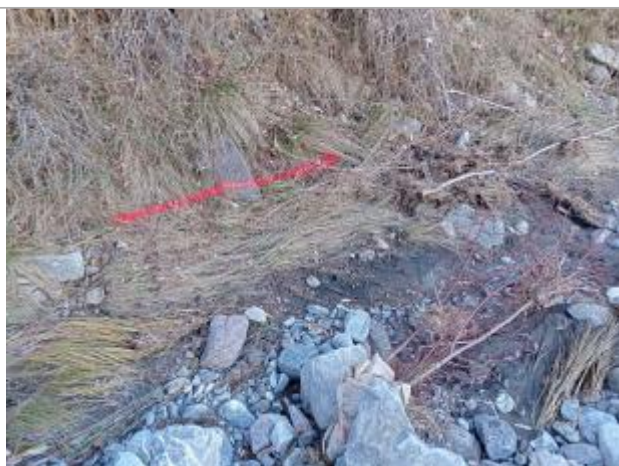
Vue rapprochée du repère.