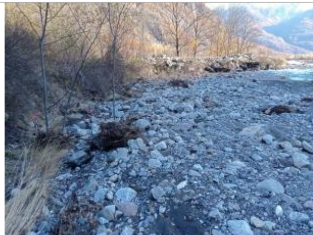
Vue générale du site.

Coordonnées WGS84 : X: 6.26264750 / Y: 44.71134720