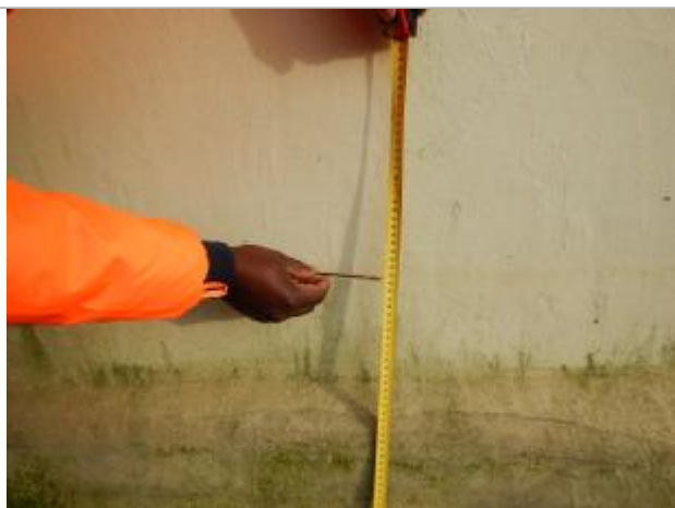
Le repère est sur le mur d'un maison privée.

LE NIVELLEMENT A ÉTÉ RÉALISÉ PAR LE SYMCÉA. LE SYMCÉA N'EST PAS EXPERT GÉOMÈTRE. LA VALEUR RENSEIGNÉE EST DONC À TITRE INDICATIVE. - 29/01/2024