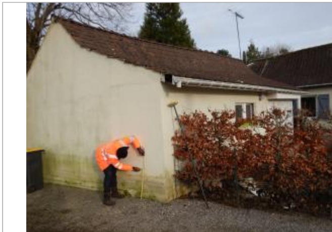
Le site est le mur d'une maison privée.