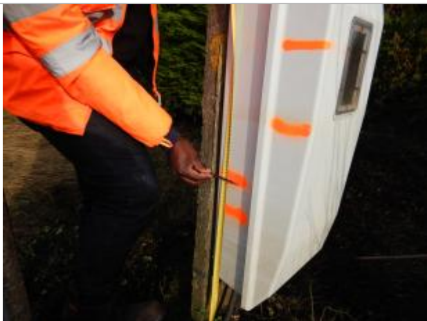
Le repère se trouve sur un coffret électrique

LE NIVELLEMENT A ÉTÉ RÉALISÉ PAR LE SYMCÉA. LE SYMCÉA N'EST PAS EXPERT GÉOMÈTRE. LA VALEUR RENSEIGNÉE EST DONC À TITRE INDICATIVE. - 29/01/2024