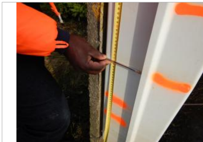
Le repère se trouve sur un coffret électrique

LE NIVELLEMENT A ÉTÉ EFFECTUÉ PAR LE SYMCÉA, QUI N'EST PAS UN EXPERT GÉOMÈTRE. PAR CONSÉQUENT, LA VALEUR INDIQUÉE EST À TITRE INDICATIF. - 29/01/2024