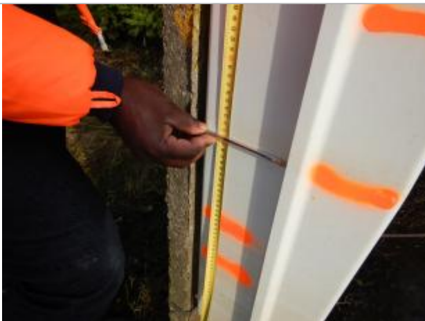
Le repère se trouve sur un coffret électrique

LE NIVELLEMENT A ÉTÉ EFFECTUÉ PAR LE SYMCÉA, QUI N'EST PAS UN EXPERT GÉOMÈTRE. PAR CONSÉQUENT, LA VALEUR INDIQUÉE EST À TITRE INDICATIF. - 29/01/2024