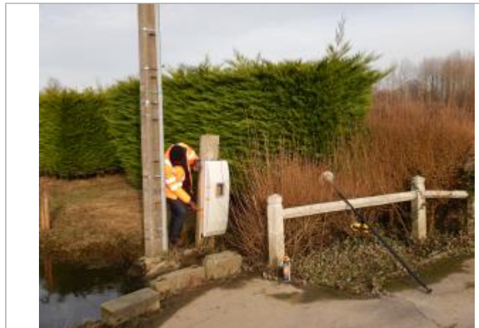
Le site est un coffret électrique

Coordonnées WGS84 : X: 1.72870630 / Y: 50.48316920