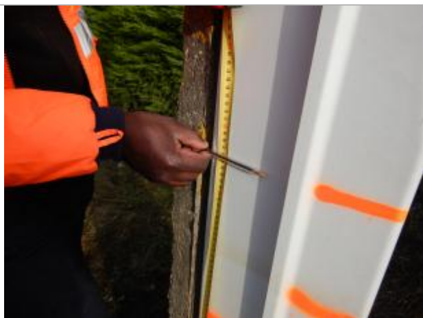
Le repère est sur un coffret électrique

LE NIVELLEMENT A ÉTÉ EFFECTUÉ PAR LE SYMCÉA, QUI N'EST PAS UN EXPERT GÉOMÈTRE. PAR CONSÉQUENT, LA VALEUR INDIQUÉE EST À TITRE INDICATIF. - 29/01/2024