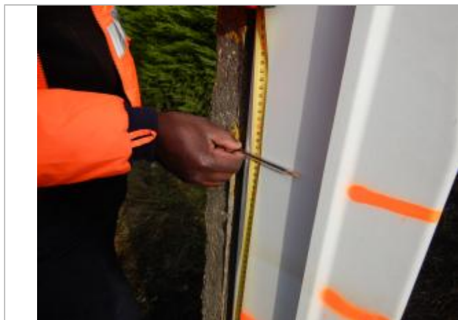
Le repère est sur un coffret électrique

LE NIVELLEMENT A ÉTÉ EFFECTUÉ PAR LE SYMCÉA, QUI N'EST PAS UN EXPERT GÉOMÈTRE. PAR CONSÉQUENT, LA VALEUR INDIQUÉE EST À TITRE INDICATIF. - 29/01/2024