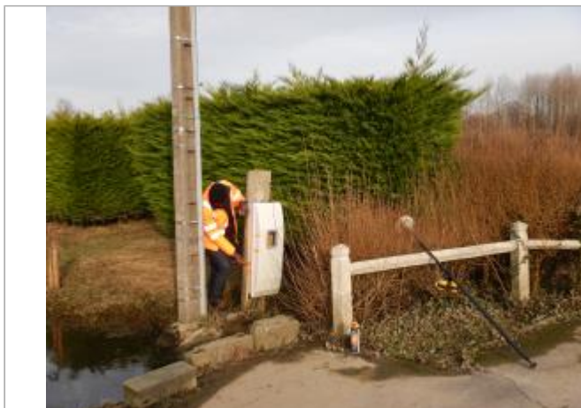
Le site est un coffret électrique

Coordonnées WGS84 : X: 1.72870630 / Y: 50.48316920