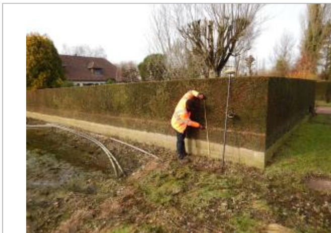
Le site est une haie.

Coordonnées WGS84 : X: 1.72834850 / Y: 50.48089370