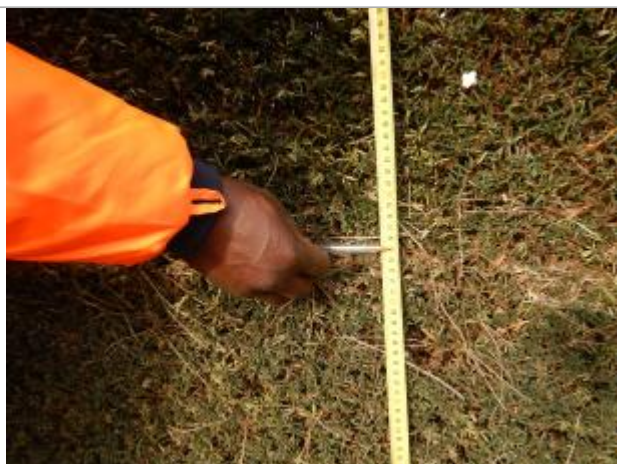
Le repère se trouve sur une haie.

LE NIVELLEMENT A ÉTÉ EFFECTUÉ PAR LE SYMCÉA, QUI N'EST PAS UN EXPERT GÉOMÈTRE. PAR CONSÉQUENT, LA VALEUR INDIQUÉE EST À TITRE INDICATIF. - 29/01/2024