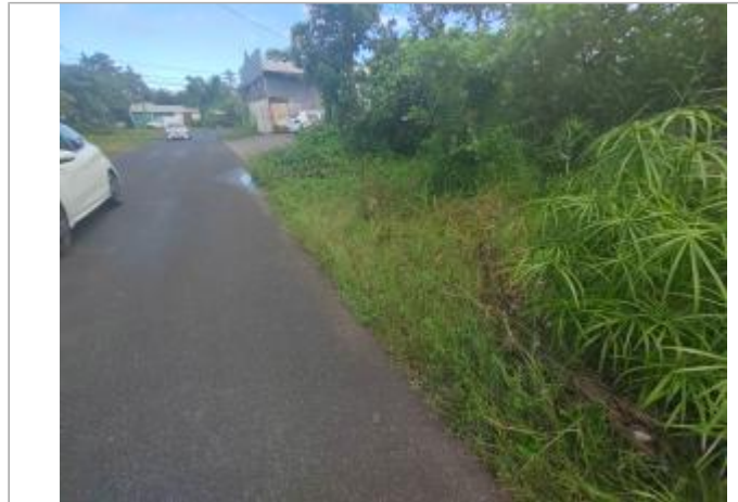
Dépôts de matières solides sur le bas côté de la route