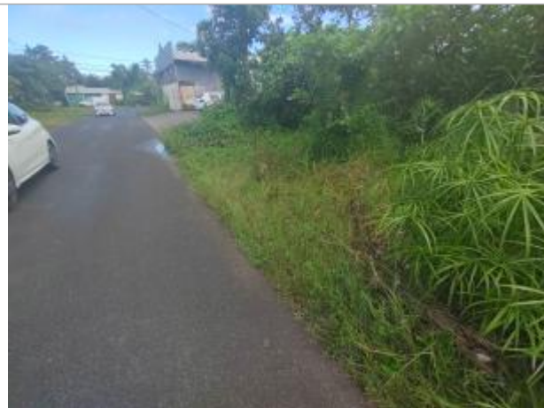
Dépôts de matières solides sur le bas côté de la route