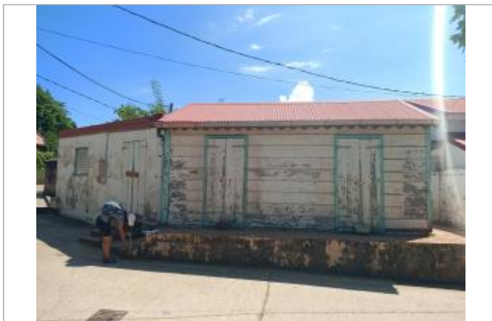
Vue depuis l'école primaire