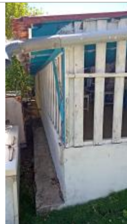
Façade extérieure le long du canal d'eaux pluviales