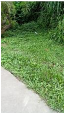
Applatissement végétation en direction d'un fossé/ravine