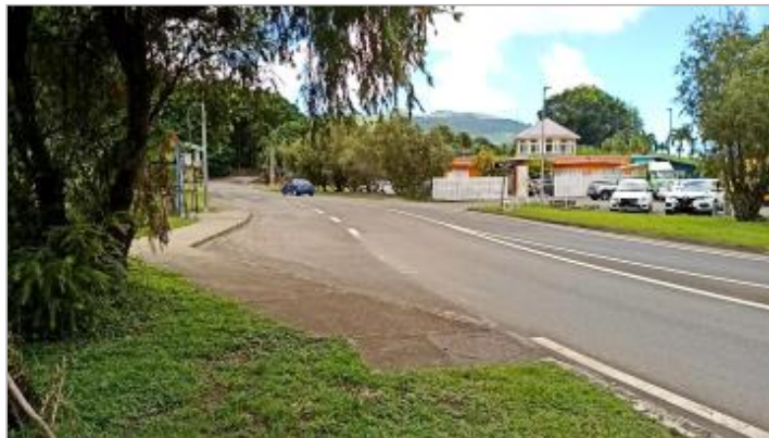
Vue en direction rond point de la Bouteille

Coordonnées WGS84 : X: -61.68335534 / Y: 15.99075673