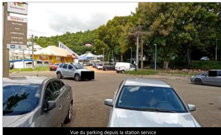
Vue du parking depuis la station service

GÉOLOCALISATION Coordonnées WGS84 : X: -61.71566250 / Y: 15.98140520 (RRAF 91)UTM 20N X: 637435.82 / Y: 1767302.68 Coordonnées RGF93 (ETRS89) : X: -61.7156625 / Y: 15.9814052 Code Hydro: 12160020 Rive de référence: