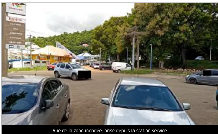
Vue de la zone inondée, prise depuis la station service

MARQUE Maximum de l'inondation : Oui Visibilité : Oui État du repère : Disparu Pérennité : Aucune