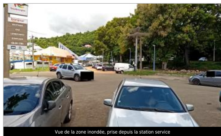
Vue de la zone inondée, prise depuis la station service

MARQUE Maximum de l'inondation : Oui Visibilité : Oui État du repère : Disparu Pérennité : Aucune