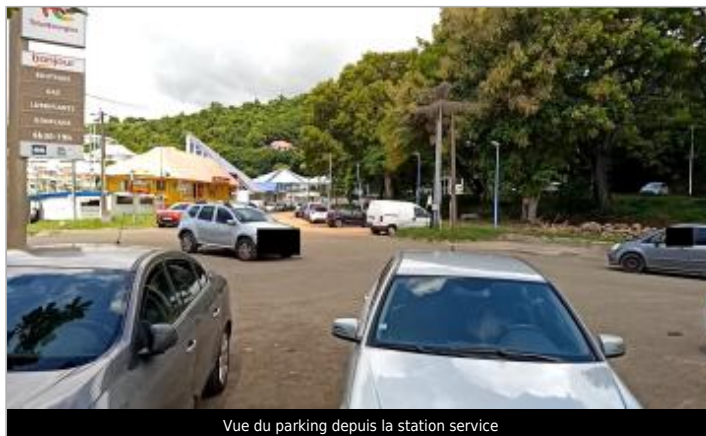
Vue du parking depuis la station service

GÉOLOCALISATION Coordonnées WGS84 : X: -61.71566250 / Y: 15.98140520 (RRAF 91)UTM 20N X: 637435.82 / Y: 1767302.68 Coordonnées RGF93 (ETRS89) : X: -61.7156625 / Y: 15.9814052 Code Hydro: 12160020 Rive de référence: