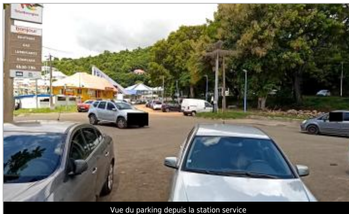
Vue du parking depuis la station service