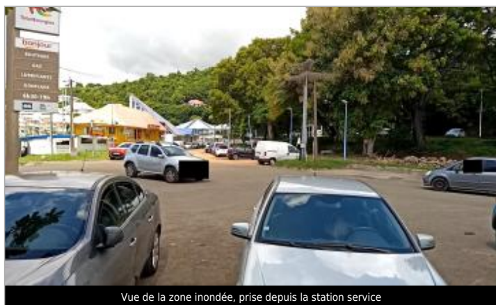
Vue de la zone inondée, prise depuis la station service

Maximum de l'inondation : Oui Visibilité : Oui État du repère : Disparu Pérennité : Aucune