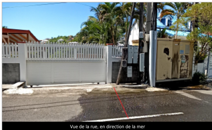
Vue de la rue, en direction de la mer