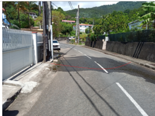
Vue de la rue dans le sens Trois-Rivières Basse-terre