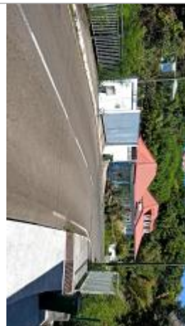
Vue de l'ouvrage, dans le sens Basse-terre vers Trois-Rivières