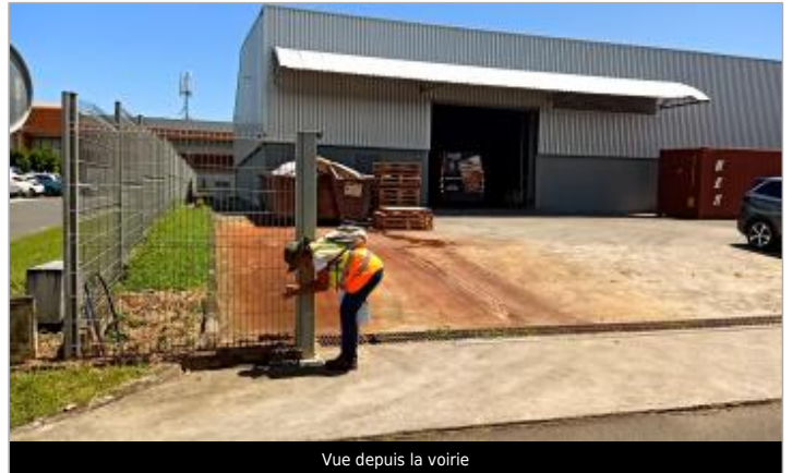
Vue depuis la voirie