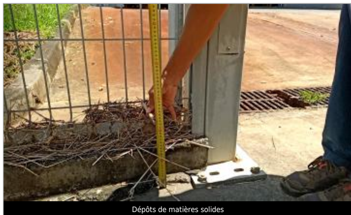
Dépôts de matières solides