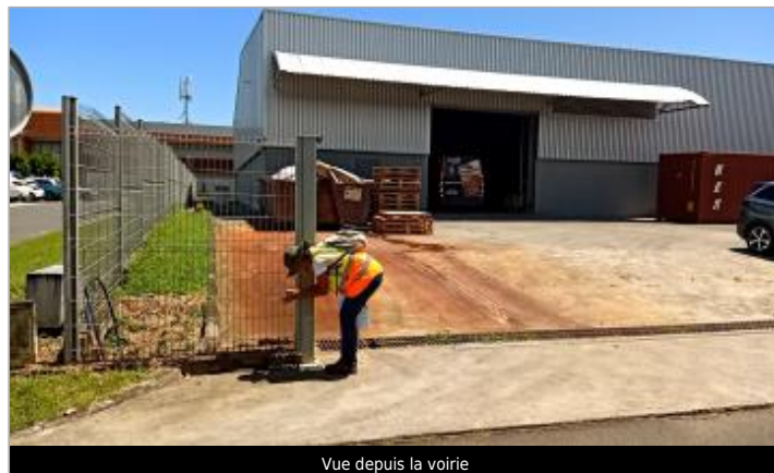
Vue depuis la voirie

Coordonnées RGF93 (ETRS89) : X: -61.6064 / Y: 16.2041