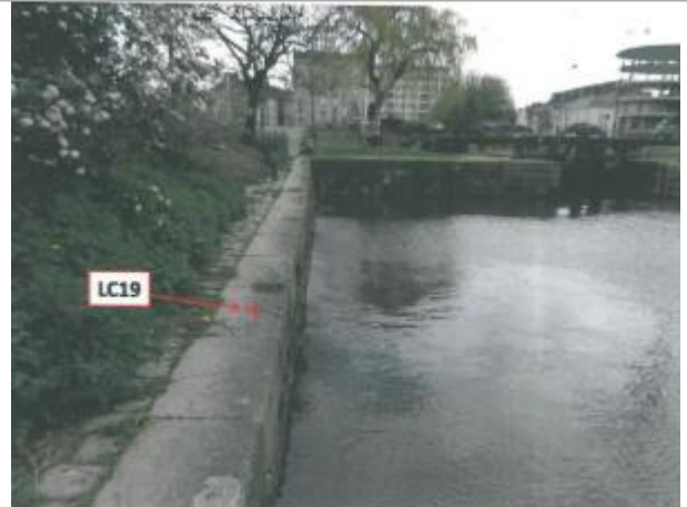
quai rive gauche en amont de l'écluse du Mail

Coordonnées WGS84 : X: -1.68620731 / Y: 48.11124270