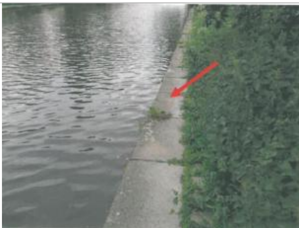
Quai du canal rive gauche en amont de l'écluse du Mail

Altitude calculée de l'eau (en m) : 25.2 m