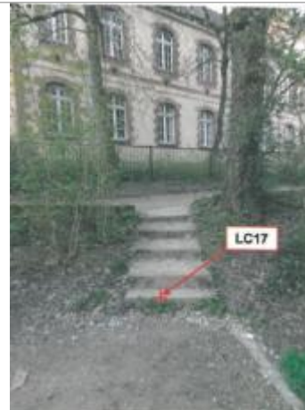
2ème escalier (le plus court) en aval de la rue Brest, rive gauche