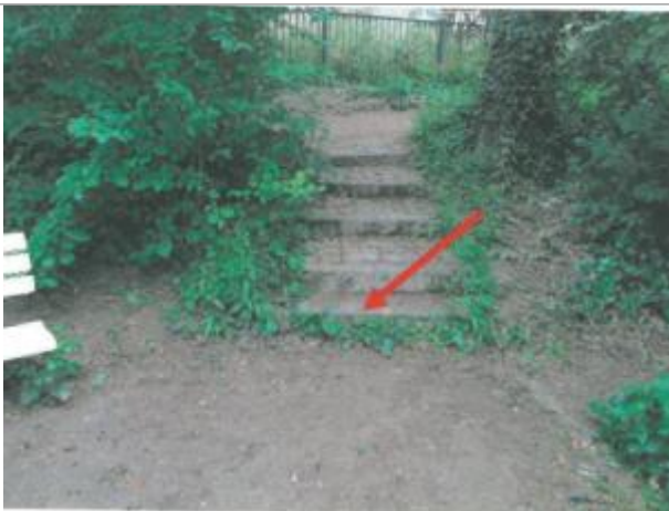
Escalier en aval de la rue de Brest, rive gauche

Altitude calculée de l'eau (en m) : 24.85