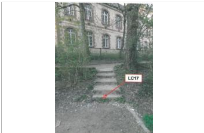
2ème escalier (le plus court) en aval de la rue Brest, rive gauche