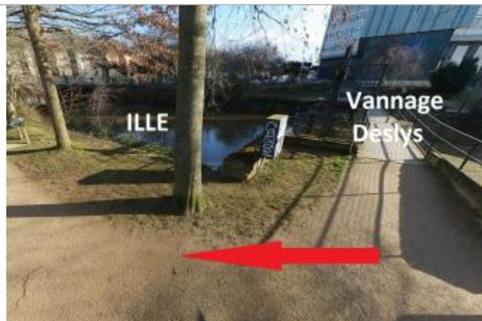
Vannage Deslys amont

Coordonnées WGS84 : X: -1.68888008 / Y: 48.11485720