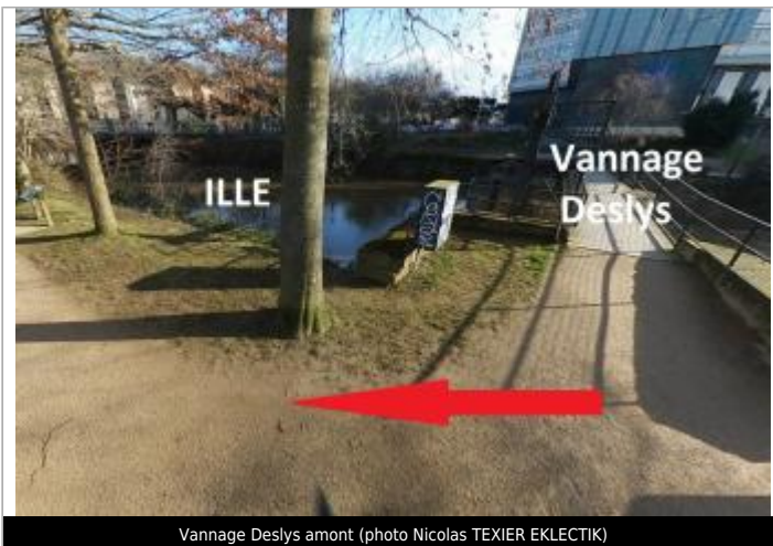
Vannage Deslys amont

GÉOLOCALISATION Coordonnées WGS84 : X: -1.68888008 / Y: 48.11485720 Coordonnées RGF93 (Lambert 93) X: 351268.2 / Y: 6789744.43 Coordonnées RGF93 (ETRS89) : X: -1.6888801 / Y: 48.1148572 Code Hydro: J71-0300 Rive de référence: Droite