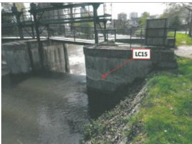
Pile amont rive droite du vannage Deslys

Altitude calculée de l'eau (en m) : 25.43 m