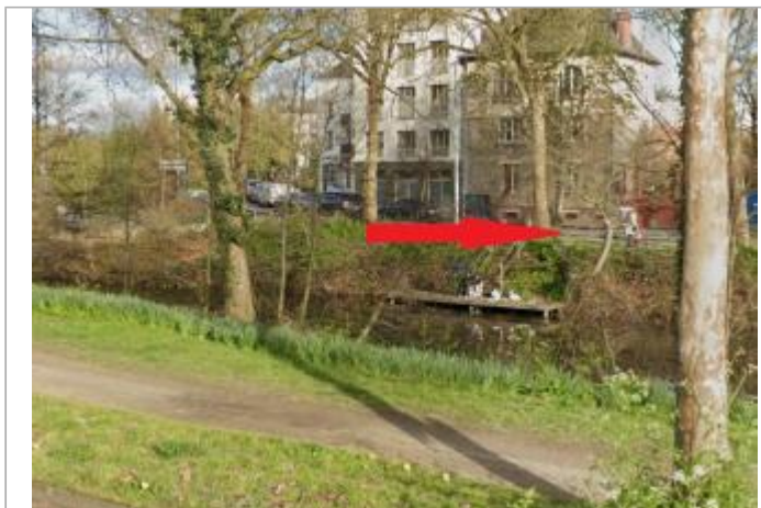
Devant le 50 boulevard de Chézy, rive gauche du canal d'Ille et Rance