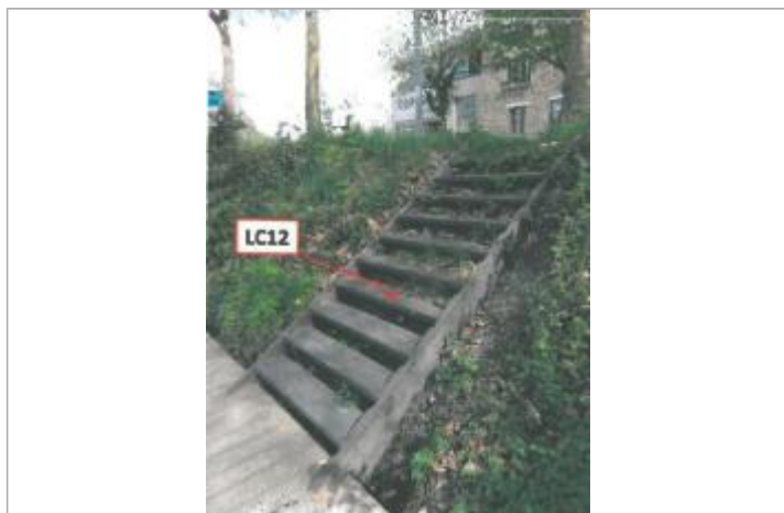
Escalier en bas descendant à l'Ille canalisée

Altitude calculée de l'eau (en m) : 25.54 m