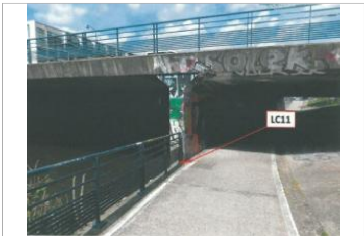
sous le pont de la rue Saint-Malo

MARQUE Maximum de l'inondation : Oui Visibilité : Non État du repère : Disparu Pérennité : Aucune Repère calculé : Non PHEC : Non