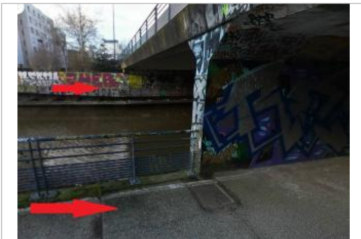
En aval du pont de la rue Saint-Malo

GÉOLOCALISATION Coordonnées WGS84 : X: -1.68230642 / Y: 48.12071440 Coordonnées RGF93 (Lambert 93) X: 351795.11 / Y: 6790365.18 Coordonnées RGF93 (ETRS89) : X: -1.6823064 / Y: 48.1207144 Code Hydro: J71-0300 Rive de référence: Gauche