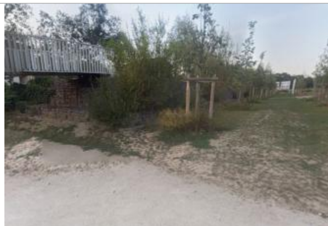
Galbions au niveau de la coulée verte

Coordonnées WGS84 : X: -1.67117619 / Y: 48.12642760