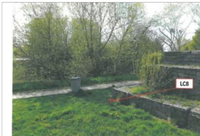
Digue en gabions support de la passerelle en 2013

Altitude calculée de l'eau (en m) : 26.25 m