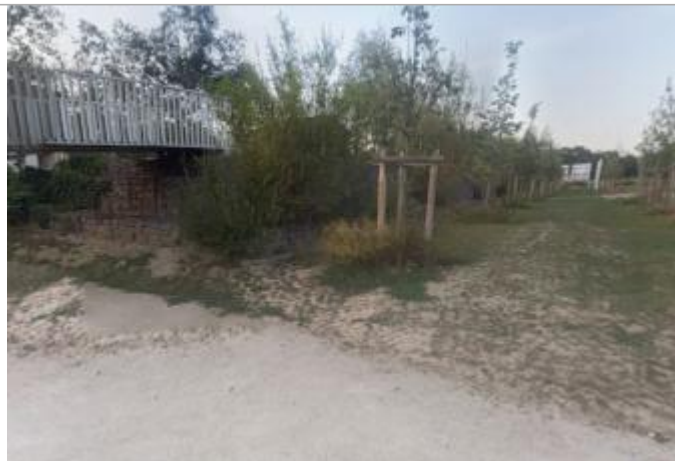
Gabions au niveau de la coulée verte