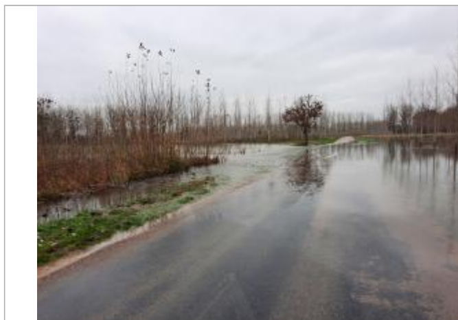
Niveau de l'eau sur la RD 99b