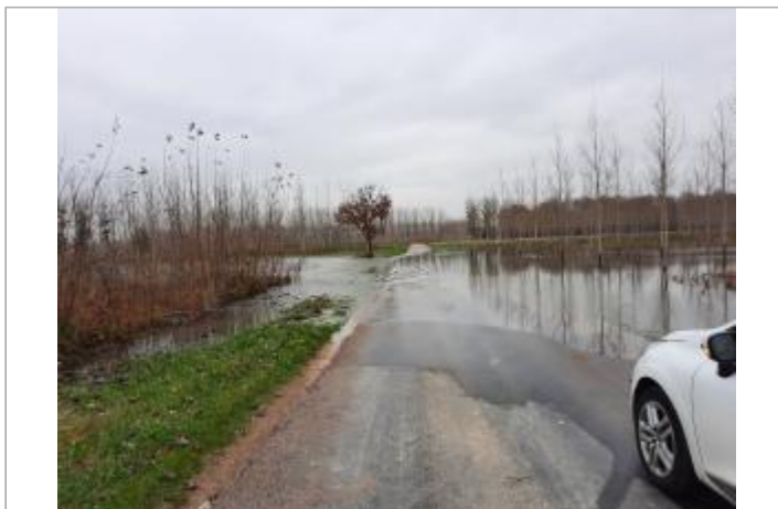
RD 99b entre Nogent sur Aube et Ramerupt