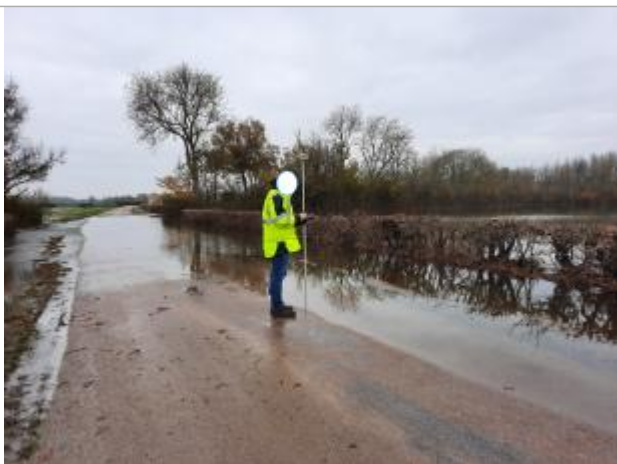
Niveau de l'eau sur la RD 65

Altitude calculée de l'eau (en m) : 83.86