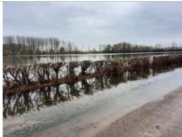
RD 65 entre Viâpres le Petit et Pouan les Vallées