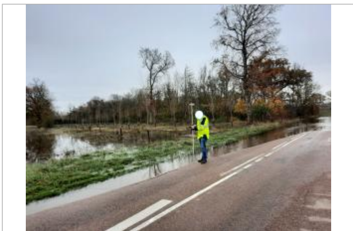
Niveau observé sur route départementale