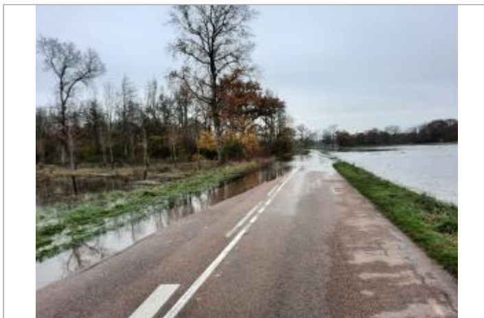
RD 71 entre Arcis et Ormes