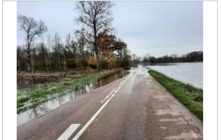
RD 71 entre Arcis et Ormes