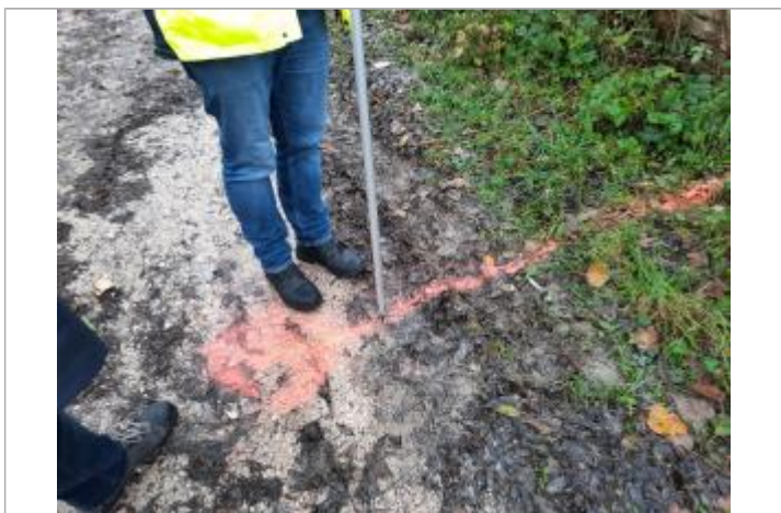
Marque peinture sur chemin