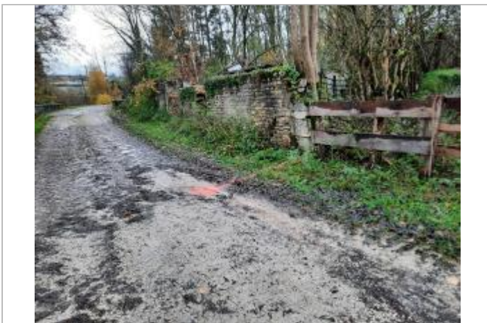
Chemin à l'aval de Rimaucourt