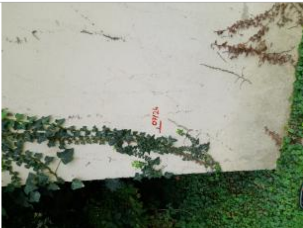
Marque peinture sur bâtiment