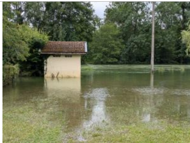
Bâtiment sur terrain communal