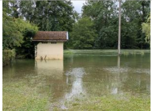
Bâtiment sur terrain communal

Coordonnées WGS84 : X: 5.12863222 / Y: 48.48700610