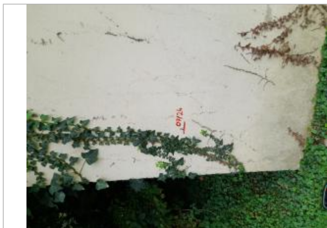
Marque peinture sur bâtiment