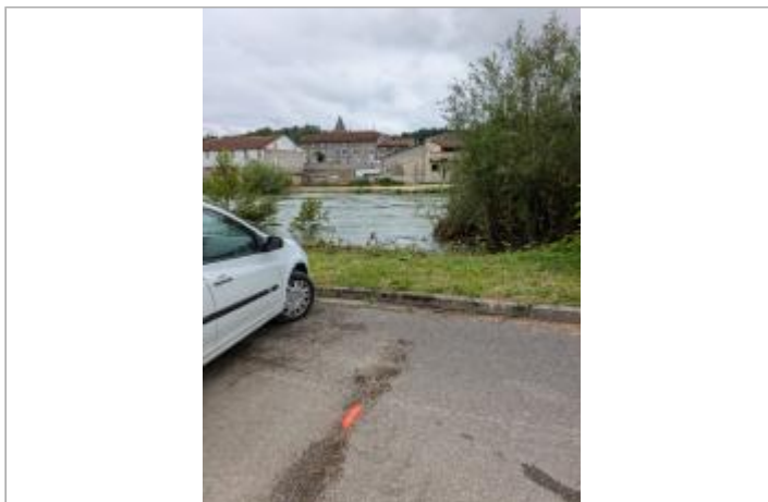
Place en rive droite du pont à Gourzon