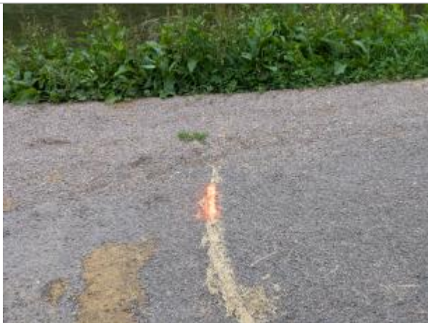
Peinture sur chemin