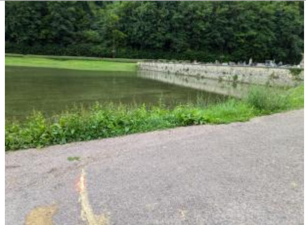
Chemin près du cimetière