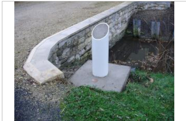
Repère et panneau sur totem, Marans