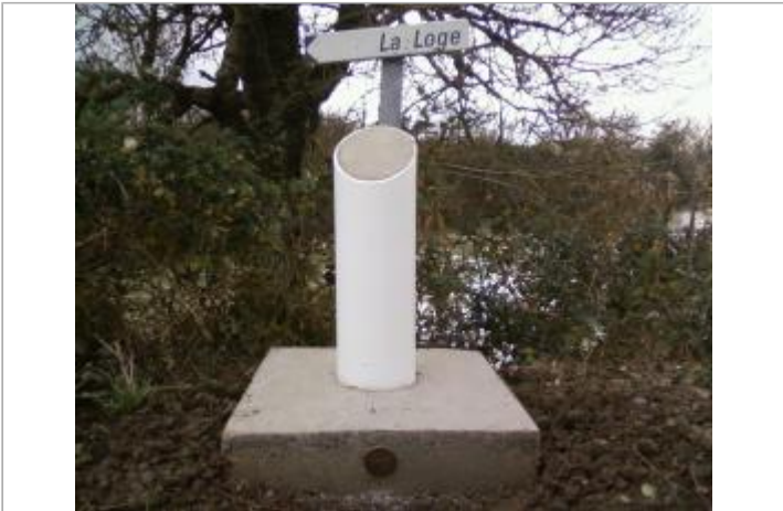
Repère et panneau sur totem, Ldt La Loge, Marans

GÉOLOCALISATION Coordonnées WGS84 : X: -1.03445380 / Y: 46.32416140 Coordonnées RGF93 (Lambert 93) X: 389736.04 / Y: 6588400.33 Coordonnées RGF93 (ETRS89) : X: -1.0344538 / Y: 46.3241614