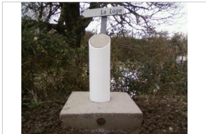
Repère et panneau sur totem, Ldt La Loge, Marans

GÉOLOCALISATION Coordonnées WGS84 : X: -1.03445380 / Y: 46.32416140 Coordonnées RGF93 (Lambert 93) X: 389736.04 / Y: 6588400.33 Coordonnées RGF93 (ETRS89) : X: -1.0344538 / Y: 46.3241614