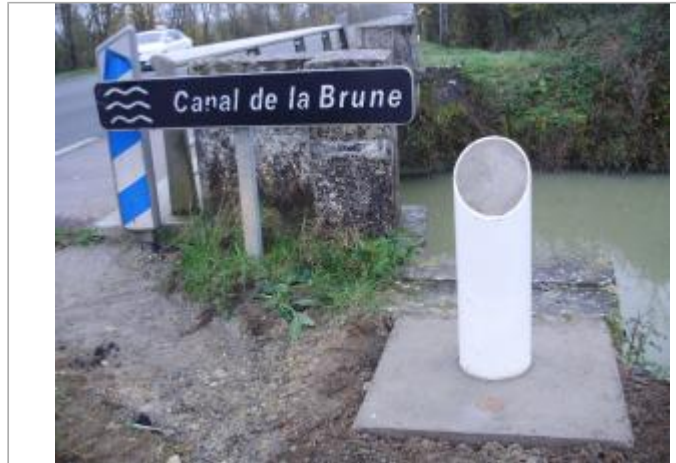
Repère sur totem à proximité du canal de la Brune, commune de Marans