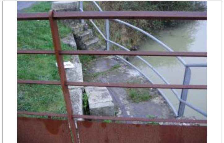
Repère et panneau sur l'ouvrage de la Brune, commune de Marans