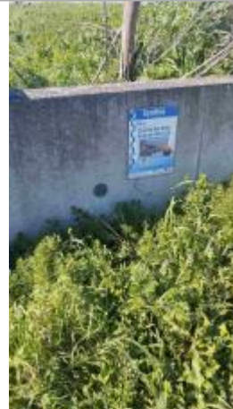
Repère et panneau sur le muret