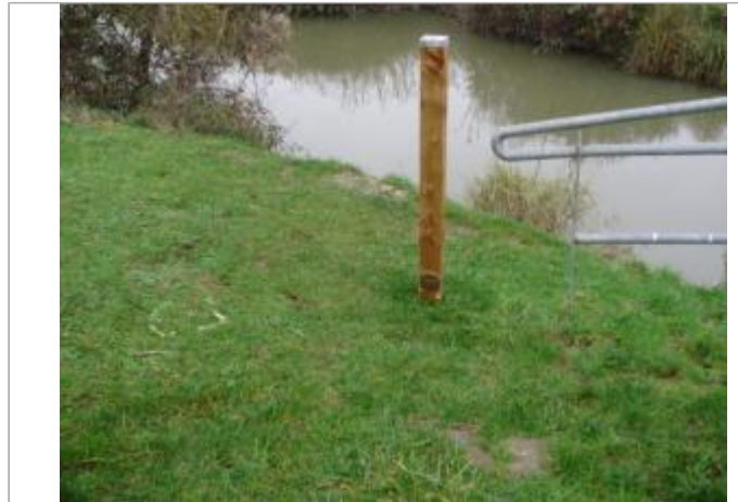
Repère et panneau d'information sur poteau à proximité de l'ouvrage