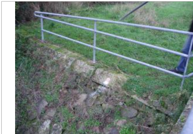
Sur ouvrage béton