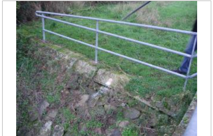
Sur ouvrage béton