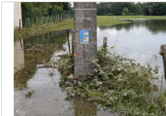
Marque peinture sur poteau EDF