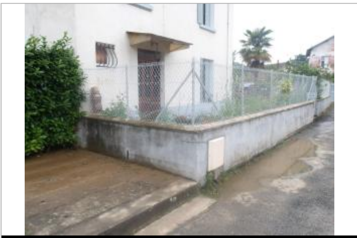
PHE plan large 1 rue des écoles

GÉOLOCALISATION Coordonnées WGS84 : X: 0.95969213 / Y: 43.10246320 Coordonnées RGF93 (Lambert 93) X: 533795.56 / Y: 6224723.69 Coordonnées RGF93 (ETRS89) : X: 0.9596921 / Y: 43.1024632