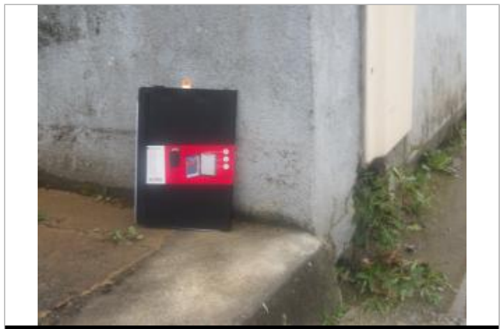
Zoom sur le PHE du 1 rue des écoles

MARQUE Maximum de l'inondation : Oui Visibilité : Oui État du repère : Disparu Pérennité : Aucune