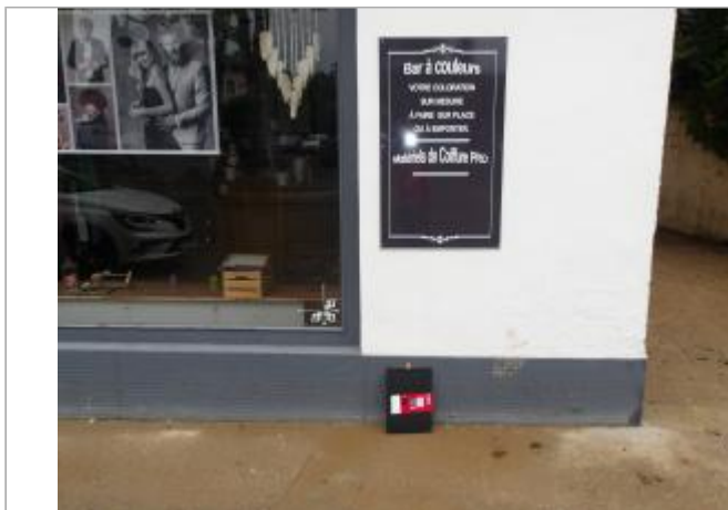
Vitrine du salon de coiffure du 27 bd Jean Jaurès avec support pour relevé PHE