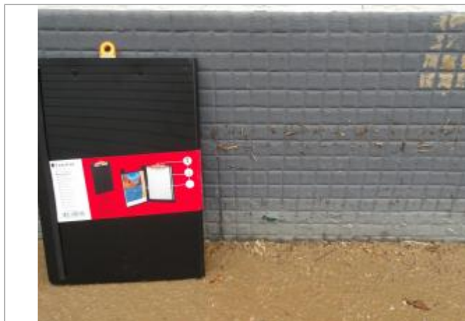
Zoom PHE 27 bd Jean Jaurès