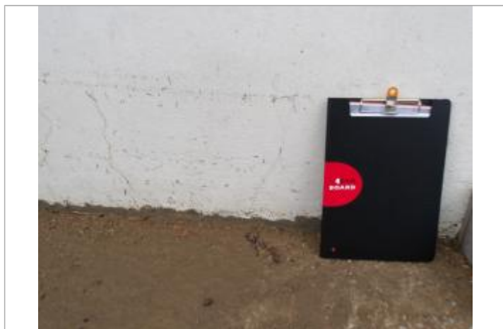
PHE_39bvd Jean Jaurès inondation Goutas

Différence entre le niveau d'eau et la référence (en m) : 0.325 m