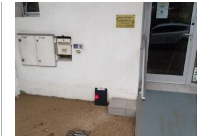
entrée du bâtiment avec PHE