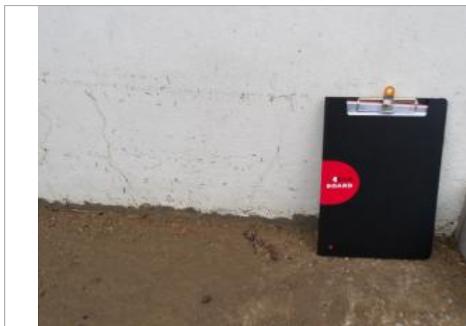
PHE_39bvd Jean Jaurès inondation Goutas

Différence entre le niveau d'eau et la référence (en m) : 0.325 m