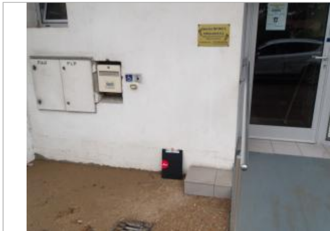
entrée du bâtiment avec PHE

Coordonnées WGS84 : X: 0.96157922 / Y: 43.10479390