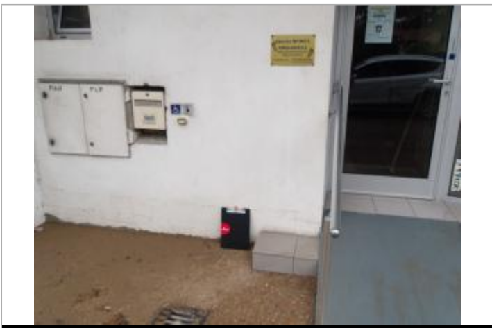
entrée du bâtiment avec PHE

GÉOLOCALISATION Coordonnées WGS84 : X: 0.96157922 / Y: 43.10479390 Coordonnées RGF93 (Lambert 93) : X: 533955.93 / Y: 6224978.77 Coordonnées RGF93 (ETRS89) : X: 0.9615792 / Y: 43.1047939