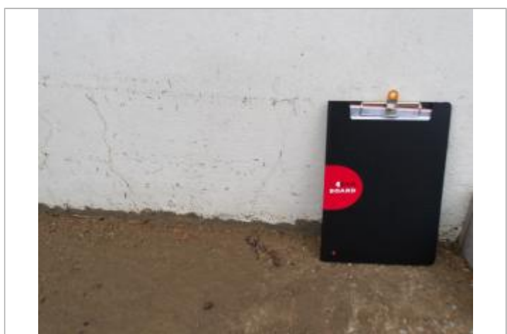
PHE_39bvd Jean Jaurès inondation Goutas

MARQUE Maximum de l'inondation : Oui Visibilité : Oui État du repère : Disparu