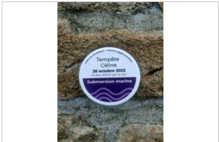
Repère de submersion - Tempête Céline 28 octobre 2023

MARQUE Texte : Tempête Céline - 28 octobre 2023 Maximum de l'inondation : Oui Visibilité : Oui État du repère : Bon Pérennité : Longue Repère calculé : Non PHEC : Non