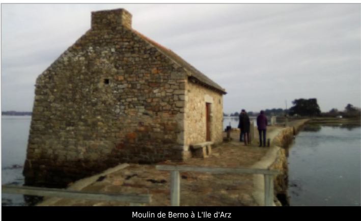
Moulin de Berno à L'île d'Arz

GÉOLOCALISATION Coordonnées WGS84 : X: -2.80497070 / Y: 47.59654690 Coordonnées RGF93 (Lambert 93) X: 264165 / Y: 6737824 Coordonnées RGF93 (ETRS89) : X: -2.8049707 / Y: 47.5965469 Code Hydro: _OATLANT Rive de référence: