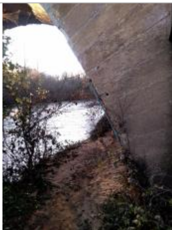
Vue de laisse

Altitude calculée de l'eau (en m) : 67.094 m